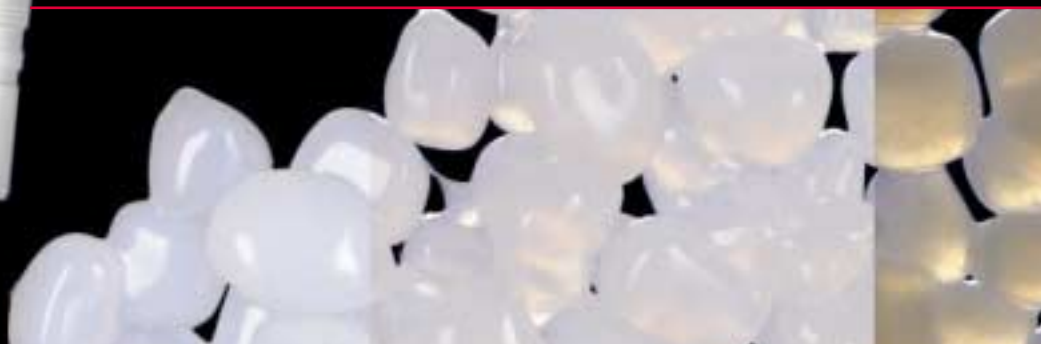
Opale fritté Duceram Kiss

Duceram Kiss vous permet de définir votre niveau d'esthétique personnel, en fonction des capacités de votre laboratoire. Duceram Kiss se compose de deux éléments utilisables séparément ou en combinaison :