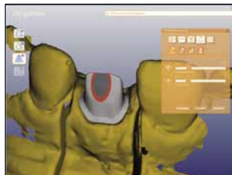
Diseñar con Cercon® art