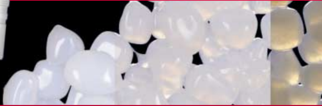
Fritta Duceram Kiss dall'effetto opalescente

Duceram Kiss offre la possibilità di definire un livello estetico del tutto personale in base alla struttura del proprio laboratorio. Duceram Kiss consiste di due componenti che possono essere utilizzate separatamente o in stretta connessione: